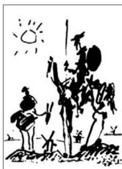
Pablo Picasso. 'Don Quijote'. Litografía