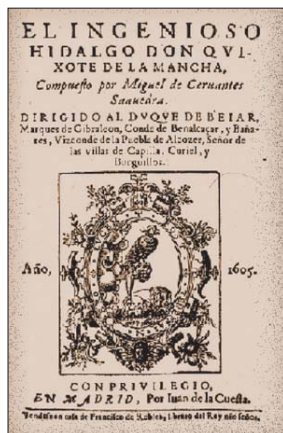
Portada de la edición facsímil de la primera parte de 'El Quijote', de 1605.