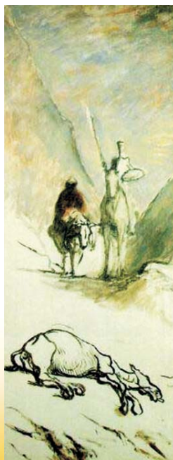
Honoré Daumier. 'Don Quijote y la mula muerta'

Varias óperas de Strauss, Massenet y Kienzl se escribieron a partir de esta novela, que también supuso un tema utilizado por, entre otros, Goya, Dalí o Picasso para numerosas pinturas, grabados, fotografías, ilustraciones, películas... inspiradas en la figura de Don Quijote.